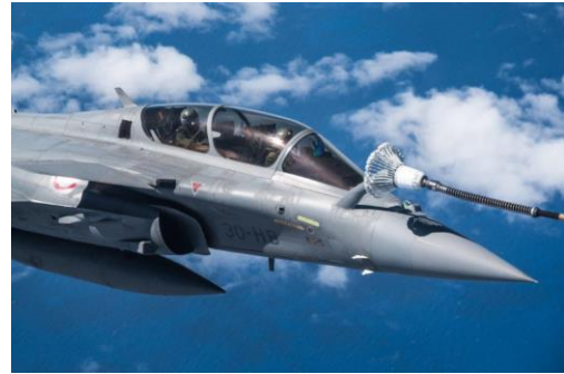
WAKEA : coopération de l'armée de l'Air et de l'Espace avec l'US Air Force à Hawaï