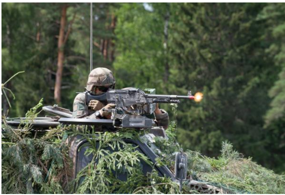
Europe du Nord et de l'Est - Mission Lynx 10 Lynx 10 : montée en puissance du Sous-groupe tactique interarmes