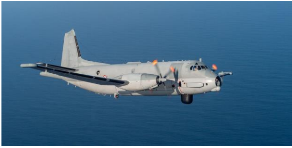
Premier vol opérationnel pour l'Atlantique 2