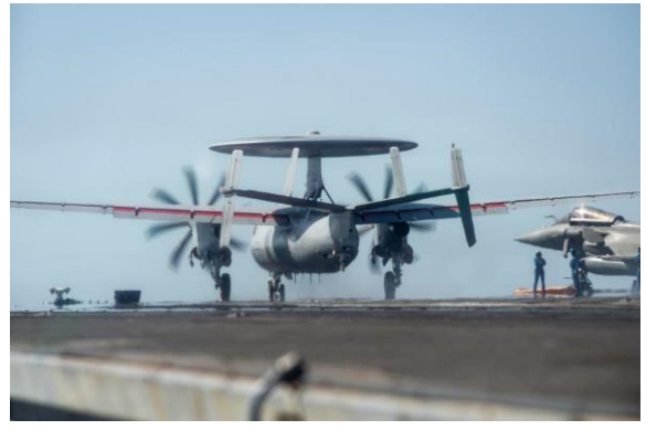
Big Fox : exercice de coopération bilatérale avec la Marine émirienne